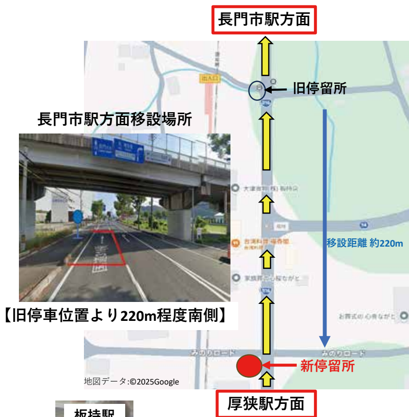
【旧停車位置より220m程度南側】