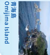
青海島 Omijima Island