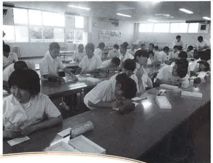
白衣を着て、聴診器体験