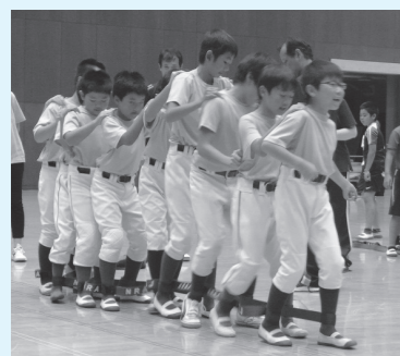
▲「むかでタイムレース・10」に挑戦

今年8月に開催されたスポーツ祭りで「むかでタイムレース・10」の記録を申請したところ、8月の月間ランキングの2位に深川野球A、3位に長門ベースポール、4位に向陽壘球軍団がランクインしました。この記録は日本レクリ