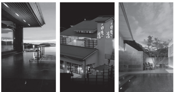
▲油谷湾温泉 (ホテル楊貴館) ▲俵山温泉 (白猿の湯) ▲長門湯本温泉 (山村別館)