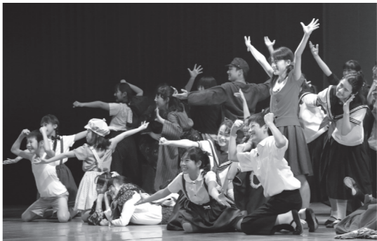
▲前回公演のフィナーレ