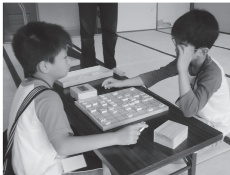
▲真剣勝負を楽しんでみませんか？