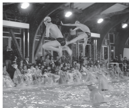
▲水しぶきとメンバーが舞う迫力満点の公演