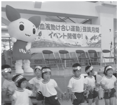
▲会場では保育園児のお遊戯などを実施