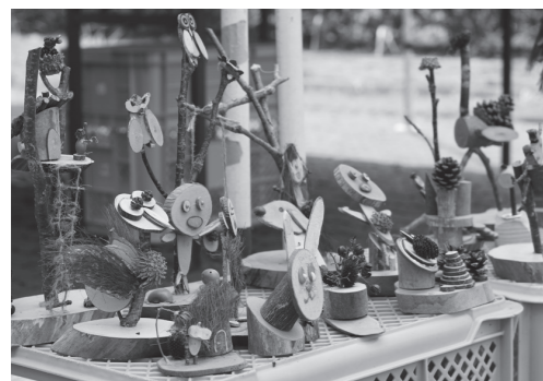
▲作品例(動物・昆虫など)