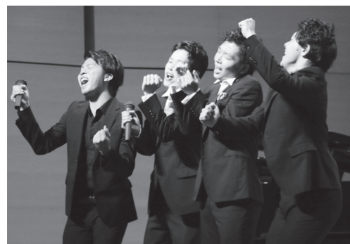
▲愉快的な学生たちが繰り広げる楽しいステージ