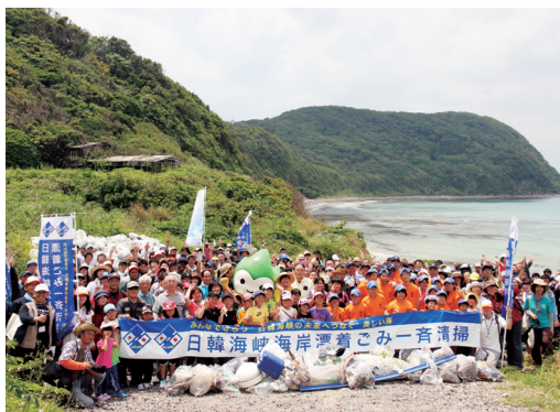
▲美しさを取り戻した海岸を背景に記念撮影

この日は地元住民や市内外からのボランティアなど約850人が参加し、海岸に漂着したペットボトルや漁網などのごみを1時間かけて拾い集めました。約3.6tの燃えるゴミと約300kgの燃えないゴミは分別され、参加者によるリレー方式で集積ポイントまで運ばれました。