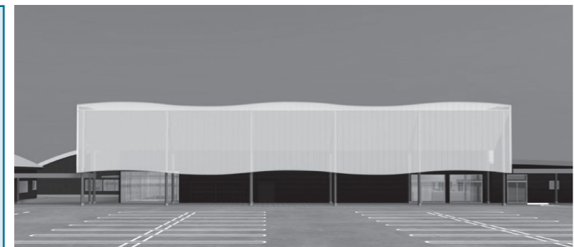
▲農林水産物等直売所・レストラン棟