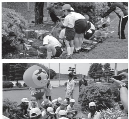
▲人権の花運動 (上:通小学校、下:向津具小学校)

街頭やイベント時に人権について呼びかける「街頭啓発」、保育園などでのキャラクターを使った「出前教室」、小学校で花を植える「人権の花運動」などを行っています。