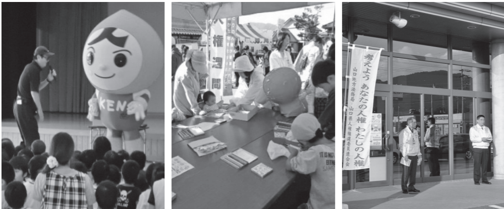
▲三隅保育園での出前教室 ▲ふるさとまつりでの啓発活動 ▲人権擁護委員による街頭啓発