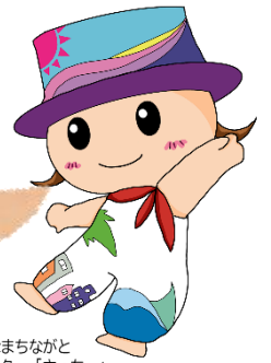
生涯「健幸」なまちなごと イメージキャラクター「さっちー」