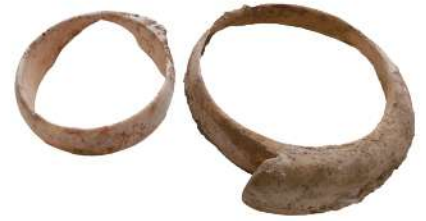
イモガイ製貝輪(吉野ケ里遺跡出土、佐賀県蔵)

重要文化財有柄細形銅剣は、明治34年(1901)に山口県大津郡向津具村(現在山口県長門市油谷)の王屋敷遺跡で発見されました。剣身と柄を一体として鑄造した珍しい銅剣で、弥生時代中期頃に大陸から伝わったと考えられます。