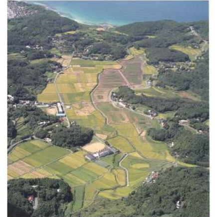
油谷本郷盆地遠景(上空から)

本展は、有柄細形銅剣の山口県内初公開です。修理が完了した有柄細形銅剣と、吉野ケ里遺跡(佐賀県)から出土した関連遺物を展示し、古代史の謎に迫ります。