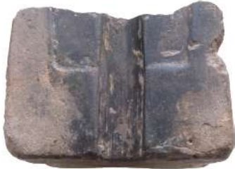
四面鑄型(吉野ケ里遺跡出土、佐賀県蔵)

昭和31年(1956)に国の重要文化財に指定されました。また、平成元年(1989)に同じ形の剣が吉野ケ里遺跡(佐賀県)で発掘され、その関係性に 관심이集まりました。