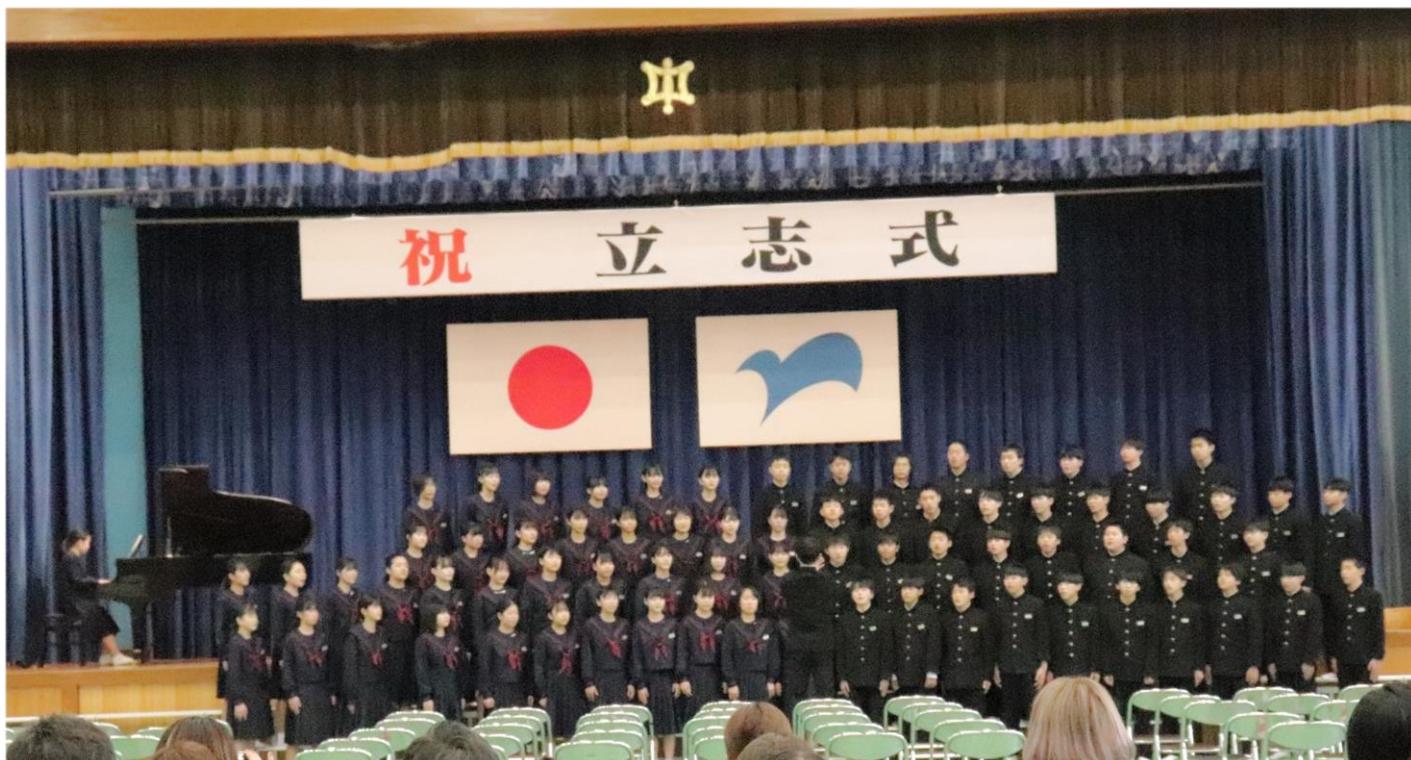
深川中学校立志式 2年生の学年合唱『次の空へ』