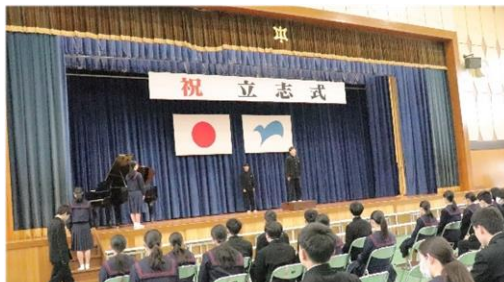
生徒一人一人の立志の言葉の発表

続いて、学年合唱として、これまでの感謝とこれからの決意を込めた『次の空へ』を2年生全員で合唱しました。