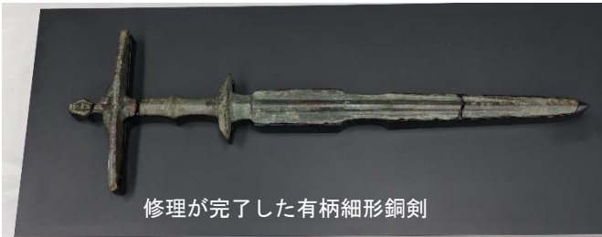
修理が完了した有柄細形銅剣

これまでに日本全国で発見された弥生時代の銅剣約700口のうち、有柄細形銅剣は5口のみです。また、佐賀の吉野ヶ里遺跡の有力者の墓から同型の剣が見つかります。今回の展示では、修理が完了した有柄細形銅剣の実物と、吉野ヶ里遺跡から出土した関連遺物を併せてご覧いただき、古代の謎に迫ります。なお、この銅剣の一般公開は、30年以上前に、佐賀県他と奈良県で行われたのみです。今回の展示はそれ以来であり、山口県では初公開となります。