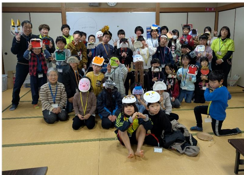
わくわく土曜塾で節分の「鬼のお面」を作りました