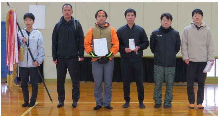
自治会対抗の部 優勝：古市A