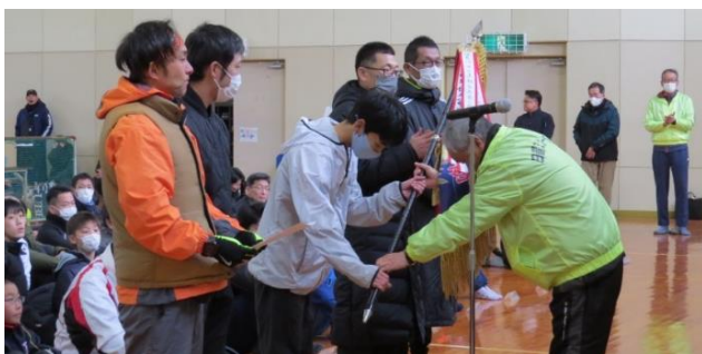
↑古市Aチームへの優勝旗授与の様子