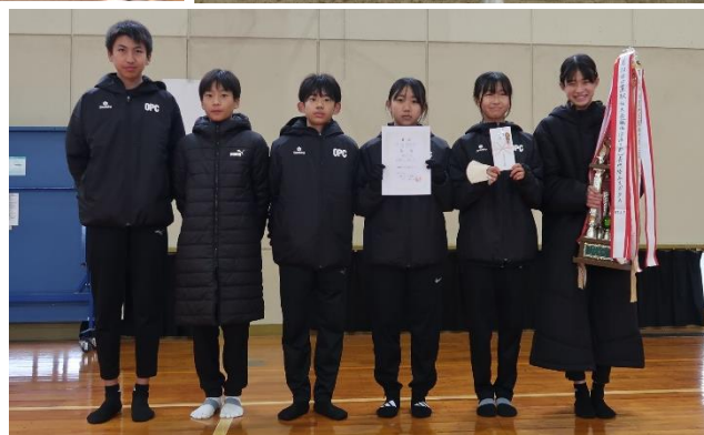
職域・団体の部 優勝：OPC B

2月1日（日）、日置スポーツ振興会主催の日置駅伝大会が開催され、自治会対抗の部に3チーム、職域・団体の部に20チームが出場し、健脚を競いました。寒空の下、選手たちは沿道の熱い声援に背中を押されながら、神田小学校から日置中学校までの6区間でタスキをつなぎました。（結果は内面に記載）