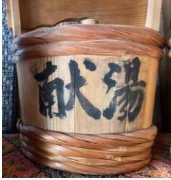
▲年頭の一湯を薬師堂に供えた湯桶