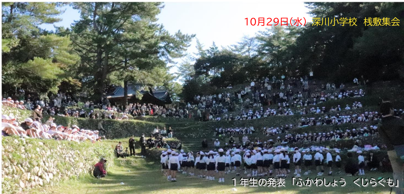
1年生の発表「ふかわしょう くじらぐも」