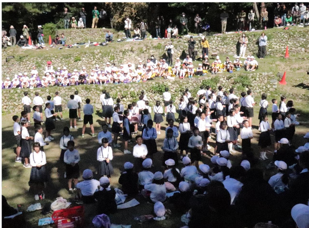
6年生の発表「語り継ぐ ～当たり前が当たり前じゃない～」