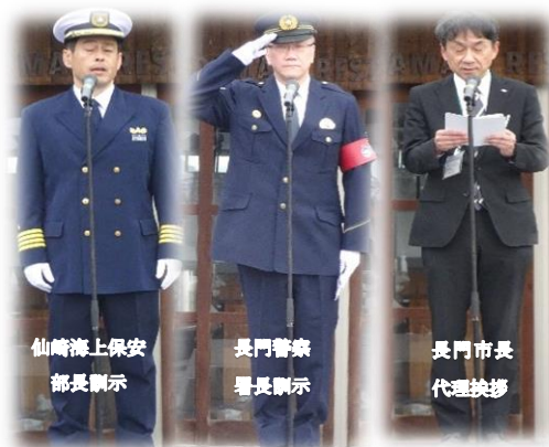
仙崎海上保安 部長訓示

令和7年12月11日、『市民の安心・安全を守る』という強い信念の下、仙崎海上保安部と長門警察署合同による年末年始警戒出動式がセンザキッチン駐車場で行われました。