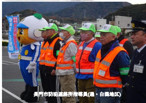
長門市防犯連絡所指導員(通・白湯地区)