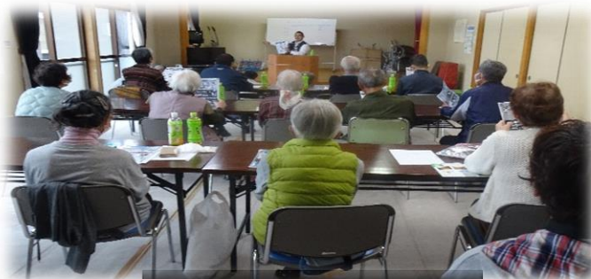
正明市2区での講習会

11/3、東深川正明市2区の敬老会において、長門警察署員によるうそ電話詐欺等被害防止の講習があり、防犯対策連合協議会では防犯のチラシとグッズを提供しました。