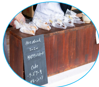
充実したエイド食

【問い合わせ】 ながとサイクルツーリズム促進協議会 TEL 0837-23-1295 MAIL k.sports@city.nagato.lg.jp