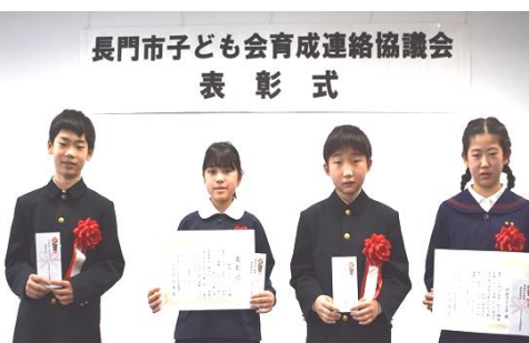
深川地区から表彰2団体、交付2団体