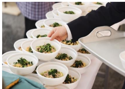
絶品！葉ワサビの瓦そば