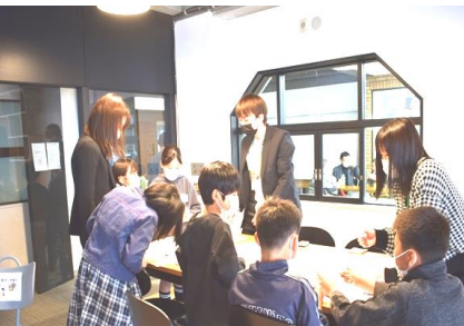
大学生とゲームで交流