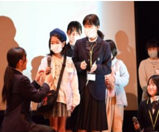
交流結果を発表する小学生