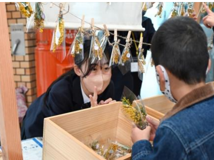
どのミモザがいい？