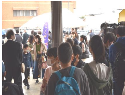
マルシェは大賑わい！

午後は、市内外から20店舗が集結し、地域の魅力を集めたマルシェを開店。人気の「御手玉わさび」や高校生とチームNGTが共同開発した「葉ワサビの瓦そば」も販売され、どの店舗も売り上げが好調だったようです。また、市民サポートなぐとでは大学生とゲームやけん玉体験に興じる小学生の歓声が響いていました。後片付け・清掃まで、終始高校生が大活躍の一日でした。