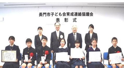
長門市全体で表彰4団体、交付3団体