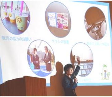
ピッチで熱弁する高校生

クアポニックス」の成功に向けた独自企画と実践について発表がありました。会場では100名を超える市内の小学生を含め200名を超える参加者と未来の長門について熱く語り合う企画もありました。