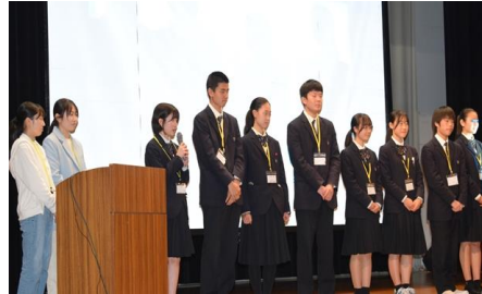
ピッチ後の質疑応答