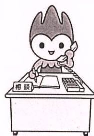
山口県PR本部長ちよるる

賃金、労働時間、退職、解雇、職場のハラスメントなど、労働問題に関するご相談に、専門の社会保険労務士がお応えします。