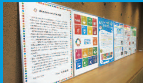
宣言書など各種展示

長門市では、持続可能な開発目標 (SDGs) の理念や視点を取り込み、誰一人取り残さない社会の実現を目指すため、令和3年7月7日に「長門市SDGsキックオフ宣言」をしました。 人口減少が続く長門市において、恵まれた自然環境を守り、心豊かで活力ある生活を送りながら、これからもこの地域に住み続けることができるよう、持続可能なまちの実現を目指しています。