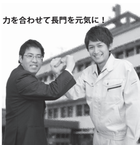
力を合わせて長門を元気に!