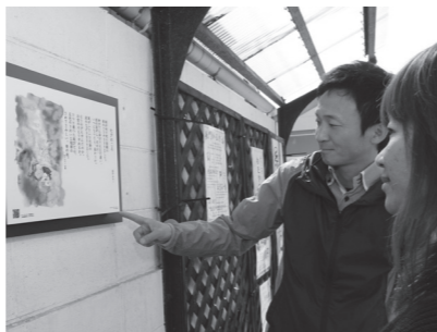
ながと成長戦略推進事業による仙崎まちなか金子みすゞギャラリー