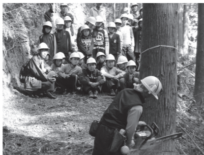
千年の森事業による森林学習