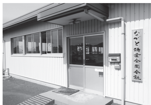
▲ながと物産合同会社