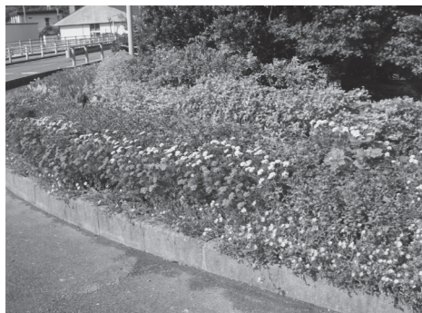
▲昨年の市長賞 小波橋花壇（三隅地区豊原）

用紙は、市役所企画政策課および各支所総合窓口課ほか、市ホームページからも入手できます