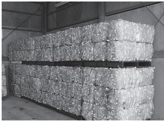
▲リサイクルセンターで仕分けられたペットボトル

平成25年度に策定した一般廃棄物処理基本計画内のごみ処理の目標として、平成33年度までに排出量を1万2,470トン（1人当たり1日約1,044グラム）へ抑制していくこととしており、今後の市民の皆さんの協力が不可欠です。