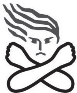
▲女性に対する暴力根絶のためのシンボルマーク

★身の危険を感じた場合は、110番、または、最寄りの警察署へ 問い合わせ 企画政策課企画調整係 TEL 23-1116