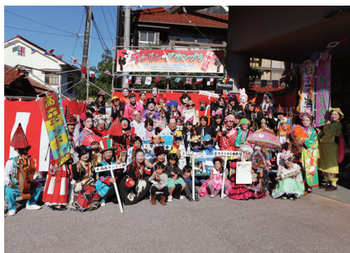
▲参加者全員で記念撮影

白猿の湯前のメインステージでは、それぞれのグループが自己紹介を行い、続いて俵山温泉街を練り歩きました。口上や楽器演奏、パフォーマンス、衣装などについて、5人の審査員が採点しました。その結果、岩国市から参加した「高森チンドン隊」がグランプリを獲得しました。