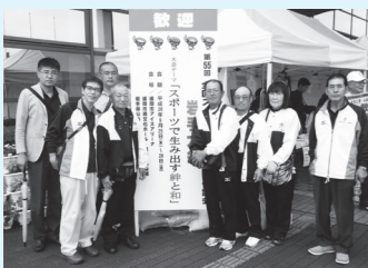
▲萩市のスポーツ推進委員の皆さんと記念撮影

この成果をもとに今後とも長門市スポーツの推進、地域の絆づくりに貢献したいと思えますので、私たちスポーツ推進委員の活用を心よりお待ちしております。