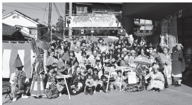
▲チンドングランプリ参加者全員で記念撮影

が、私が一番印象に残ったのはイベントの終了後、引き上げるチンドン出演者に、沿道のお客さんや関係者から『たのしかったですよ！』『来てくれてありがとう！』と拍手と共に声を掛ける姿でした。 今まで、このような感動的な光景を目の当たりにしたことが少なかったこともあり、地域の温かさを再確認させていただいた場面となりました。 今回、私は物産部会長としてこのイベントに関わらせていただきました。出演者もお客さんも企画する側も、共に喜ぶことがイベントの成功に繋がるものだと思います。このチンドングランプリを通じて学ぶことができました。 俵山地区では、まだまだイベントや地区行事が続きます。今回培ったことを良い参考にしながら、寒さに負けず、地域の皆