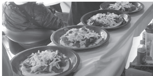
▲地元俵山はピザを提供

地域の埋もれた食資源を活用した食品や加工品により、温泉と食を組み合わせて全国発信しようと、11月22日(土)、23日(日)に俵山温泉街で「俵山イチニチレストラン」が開催されました。 22日は前夜祭として、17時からフレンチレストランやイタリアンビュッフェが開店。 チケットが売り切れるほどの人気を集めました。 翌23日は約20店舗の「なごとのレストラン&カフェ&シヨップ」が歩行者天国となった俵山温泉街にオープン。サンドウィッチやクレール、ビーフシチュー、パンなどが販売され、多くの来場者で賑わいをみせました。