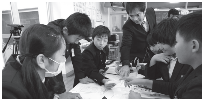
▲税金について、班員全員で意見を出し合い、まとめる

会場となった黄波戸温泉交流センター駐車場には、早朝から地元産の野菜や自然薯、レンコン、たこ焼きなどの食べ物のお店が並び多くの人が買物を楽しみました。