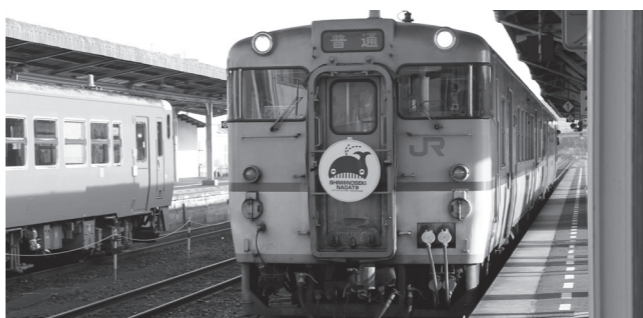
▲らじくんのヘッドマークのついたB列車が発車

それを機会に、公共交通機関の利用にもご理解ご協力をお願いします」とあいさつしました。