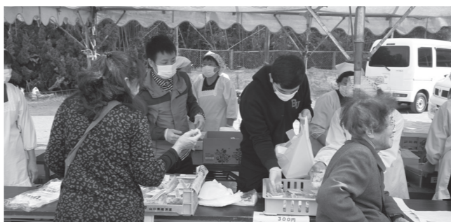
▲学生たちは、バザーの手伝いも積極的に行った