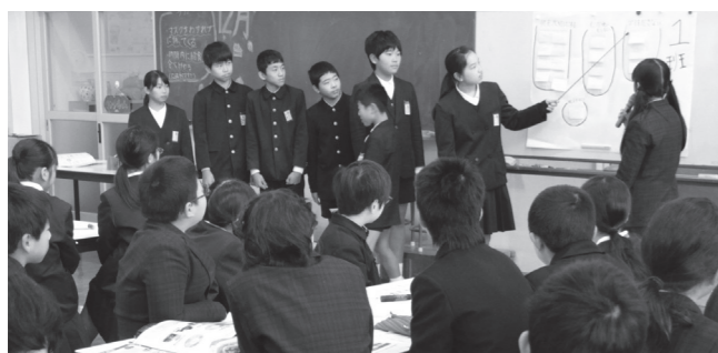
▲まとめた意見をみんなの前で発表