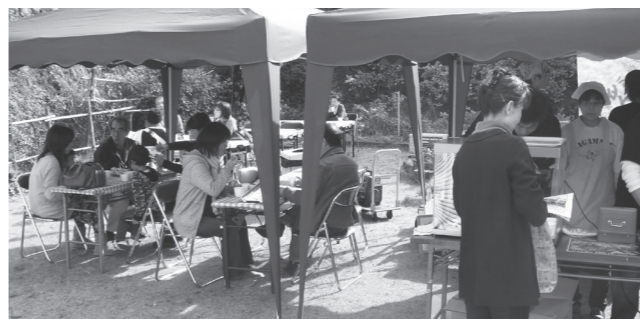
▲温泉街に登場した店舗で好みの食べ物を味わう