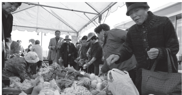
▲日置産の新鮮な野菜が販売された