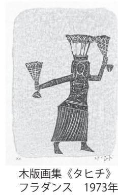
木版画集《タヒチ》フラダンス 1973年