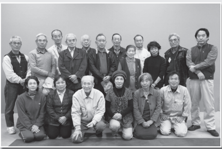
長門絵画クラブの皆さん