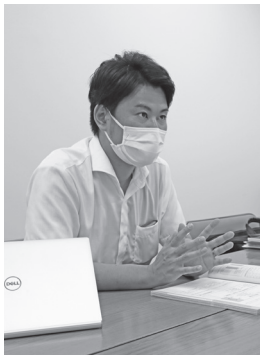
▲前回開催時の様子