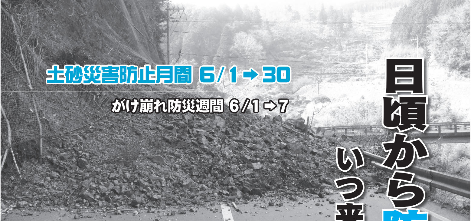
▲平成24年2月25日に突如発生した土砂崩れ（俵山地区）

総務課地域安全推進室 Tel.23-1111-1 都市建設課土木係 Tel.23-11148