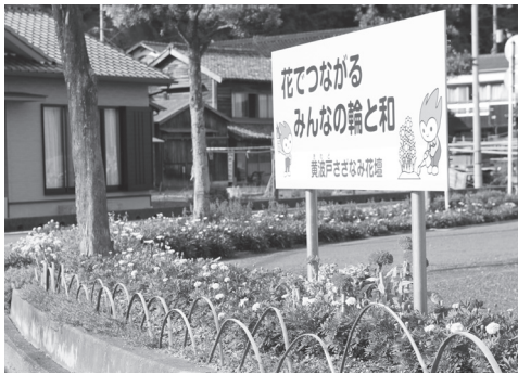
▲昨年の市長賞・黄波戸自治会さざ波会の花壇

市役所企画政策課および各支所総合窓口課ほか、市ホームページからもダウンロードできます