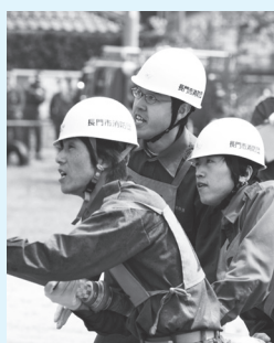
▲操法大会のようす

長門市の安全と安心を守るために、消防団とその活動に対する一層のご理解とご協力をお願いします。