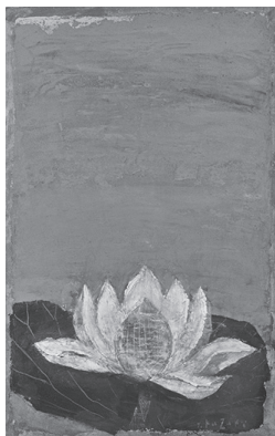
今月の1枚 〈蓮華〉1971年頃