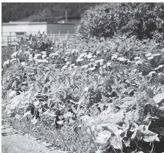
市長賞を受賞した、小波橋花壇(三隅地区豊原)