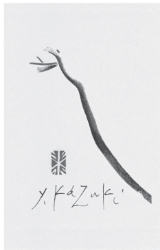
かつきやすお 香月泰男年賀状「巳」 ~日本の心「やさしさ」を奏でるまち長門~ 香月泰男「巳」