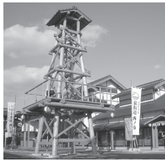
▲道の駅「蛭街道西ノ市」