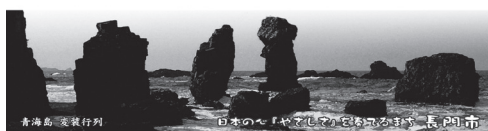
青海島 変装行列 日本への「やさしさ」を届けるまち長門市