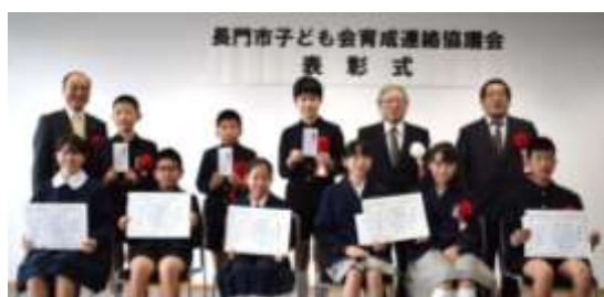
長門市全体で表彰5団体、交付4団体