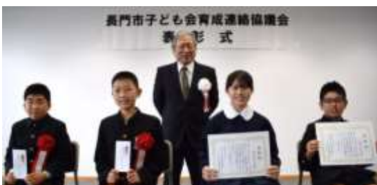
深川地区から表彰2団体、交付2団体