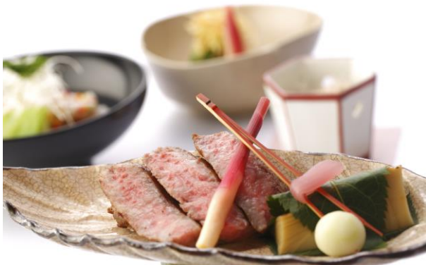
夕食例(季節に合わせた食事を提供)