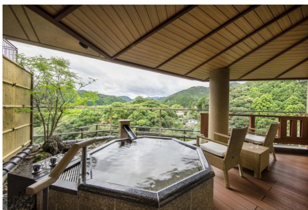
露天風呂付き客室

詳細は大谷山荘公式ホームページをご確認ください。( https://otanisanso.co.jp/ )