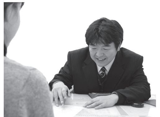
▲申告相談はお早めに

税務署や申告相談会場では、申告書を自分で作成していただくために記載方法などのアドバイスをしています。