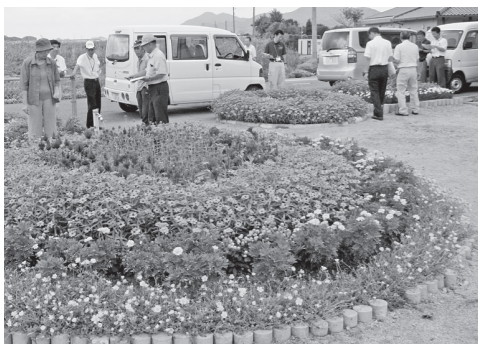
▲昨年の市長賞・殿村自治会花の会の花壇

長門市花と緑のまちづくり推進協議会では、花と緑あふれる花壇づくりを推進するために、市内全域の花壇を対象に花壇コンクールを開催します。 ■応募対象 市内で花壇づくりに取り組まれている個人・団体 ■部門 ①通りの部 おおむね延長20m以上の公共施設等花壇が対象 ②単独花壇の部 ・面積5㎡未満の部 ・規定面積の公共施設等花壇を対象とします ・面積5㎡以上の部 ・規定面積の公共施設等花壇を対象とします ③個人の部 住宅・事業所敷地等を問わず、誰もが自由に鑑賞できる個人・団体が管理する花壇 ※①および②は長門・三隅・日置・油谷の推進会議の会員を対象とします ※花の種類は問いません ■応募方法 所定の申込用紙に位置図等必要事項を記入のうえ提出ください。申込用紙