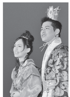
▲楊貴妃ミュージカル