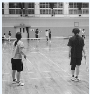
ミニテニス教室の様子

ポーツ優良団体として文部科学大臣表彰を受けました。今後も新たなクラブづくりの一助となるよう研究を重ねていきます。なお、今年度は「おいでませ! 山口国体」のリハーサル大会の年であり、5月に俄山多目的交流広場で「ラグビー大会」が、7月にルネッサながとで「空手道大会」等が開催されます。体育指導委員も山口国体の成功に向け協力していきます。