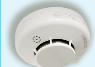
▲住宅用火災警報器

住宅火災における死者数は、平成15年以降5年連続して千人を超える高い値で推移しています。特に65歳以上の高齢者が占める割合は約6割となっております。今後の高齢化の進展とともに、さらに増加することが懸念されます。 こうした状況のもと、平成16年の消防法改正により、すべての住宅に住宅用火災警報器の設置が義務づけられました。長門市火災予防条例においても、平成23年5月末日までに設置することになってい 住宅用火災警報器の普及は、住宅防火対策の「切り札」として、皆さんの安心・安全を確保する上で極めて重要になります。 自分の、そして家族の命を守るためにも早めに設置しましょう。