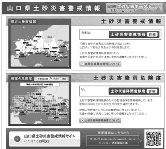
▲山口県の土砂災害警戒情報ページ http://d-keikai.pref.yamaguchi.lg.jp/dosya/

土砂災害警戒情報とは 大雨警報発表後、山口県と下関地方気象台が、土砂災害発生危険性が高まったときに発表する防災情報です。過去の降雨と土砂災害発生状況の履歴から一定の基準を設け、この基準を超えた場合、また、超えることが予想される場合に市町単位で発表されます。 土砂災害警戒情報が発表されると 市では、ケーブルテレビの緊急文字放送や音声放送などによる警戒や避難の呼びかけを行います。また、広報車により土砂災害の危険のある特定地域内の住家に避難