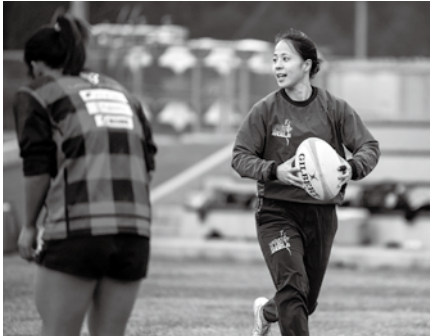
▲ながとブルーエンジェルの選手として、太陽生命ウイメンズセブンズシリーズ2連覇に貢献した