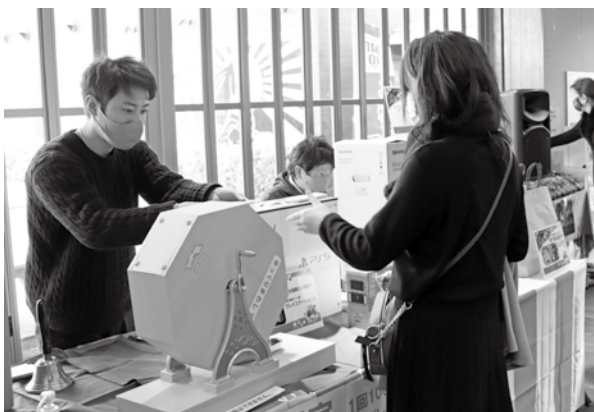
▲昨年の抽選会の様子