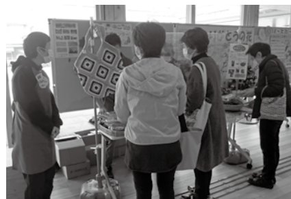
▲実際の販売会の様子