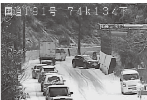
※雪道の走行には注意