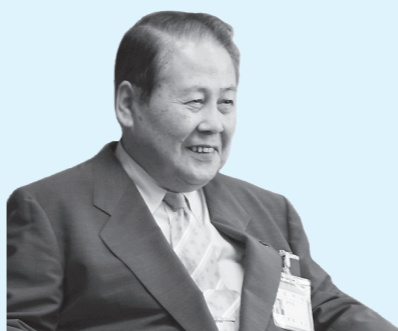
まちづくり懇談会日程表（前期）

前期につきましては、10月12日から11月13日までの間、順次開催してまいりますので、皆様お誘い合わせの上、是非ご参加くださいますようお願い申し上げます。また、対象地区以外の皆様のご参加もお待ちしております。