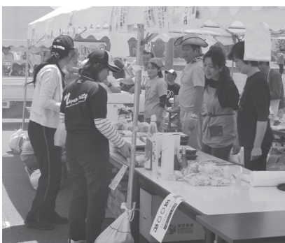
▲ラグビー競技プレ大会の売店のようす

※長門市内の業者は1コマ5,000円 ※1コマは1/2テントです ※電気・水道を使用する場合は2,000円(どちらか1つの場合、1,000円) ※付属品は机2台と椅子4脚。追加料金がかります