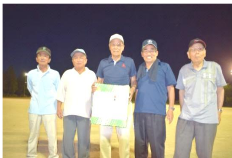
優勝した赤崎GGクラブ(B)の皆さん