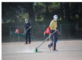
準備や運営で役員の皆さんが大会を支えます