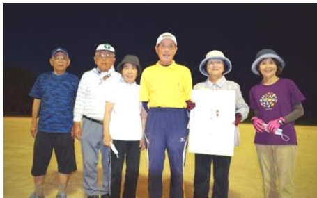
準優勝の板持クラブの皆さん