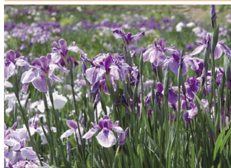
ハナショウブ／飯森公園